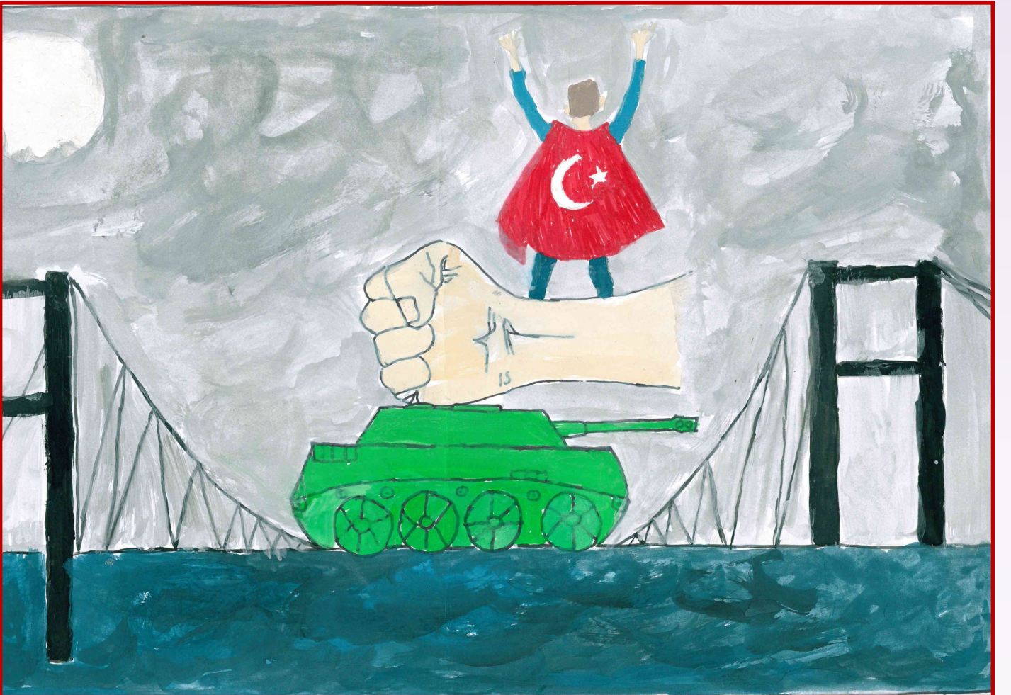
Resim: Aybars ŞAKRAKER